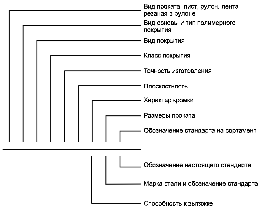
Схема условных обозначений проката с полимерным покрытием

П р и м е ч а н и е — При отсутствии какого-либо из параметров его выбирает предприятие-изготовитель.